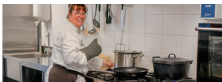
Verse maaltijden door eigen kok