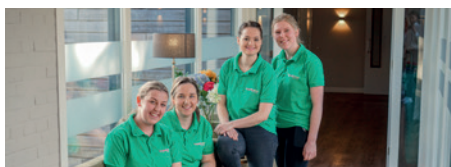
Klein en vast team