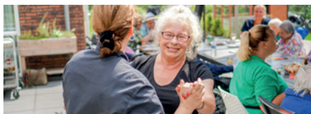
Alles mag, niets moet