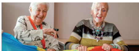
Elke dag anders