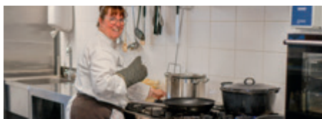
Verse maaltijden door eigen kok