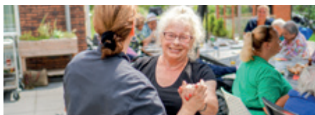
Alles mag, niets moet